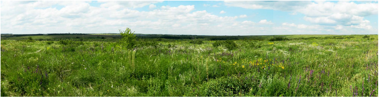
Рис. 1. Характерный ландшафт заповедника «Хомутовская степь».

и река превращается в цепь полуизолированных бассейнов (рис. 2В, 2Г). Вода из нее используется для водоснабжения прилегающих населенных пунктов и предприятий, а также для оросительных работ в сельском хозяйстве. Изолированность бассейна реки для многих групп водных беспозвоночных делает ее чрезвычайно чувствительной к любым антропогенным воздействиям, в связи с чем изучение ее современного видового состава представляет особый интерес.