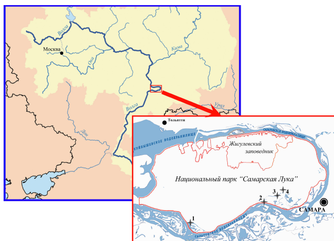
Рис. 1. Карта пунктов отлова обыкновенного и водяного ужей в национальном парке «Самарская Лука». Условные обозначения: звездами на карте обозначены места отлова рептилий; 1 – Мордовинская пойма; 2 – Змеиный затон; 3 – с. Шелехметь; 4 – оз. Клюквенное Болото.

Fig. 1. Map of trapping stations of Natrix natrix and N. tessellata in the Samarskaya Luka National Park. Designations: asterisks indicate the catching places of reptiles; 1 – Mordovinskaya floodplain; 2 – backwater Zmeinyi; 3 – village Shelekhmet; 4 – Lake Klyukvennoe Boloto.