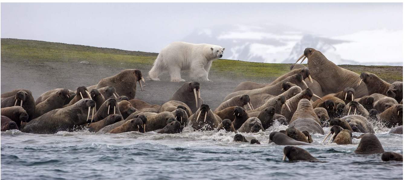
Рис. 4. Белый медведь ( Ursus maritimus ) инспектирует лежбище атлантических моржей ( Odobenus rosmarus rosmarus ) на острове Аполлонова, архипелаг Земля Франца-Иосифа.