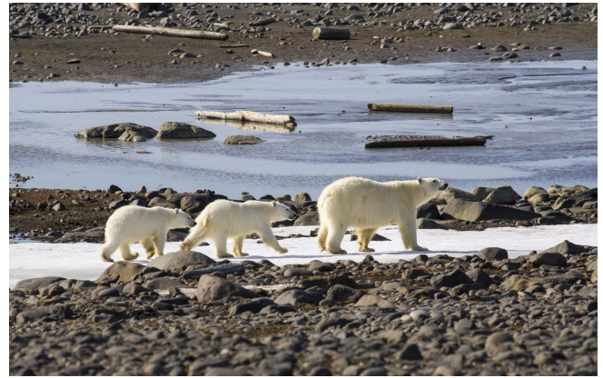
Рис. 3. Медведица с медвежатами ( Ursus maritimus ) на побережье архипелага Земля Франца-Иосифа.