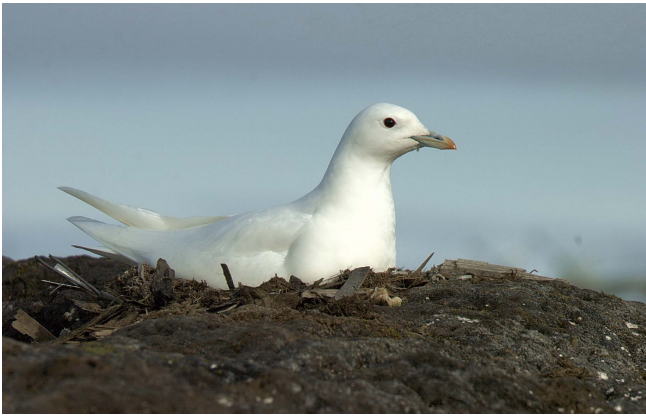
Рис. 2. Белая чайка ( Pagophila eburnea ) на гнезде, Земля Александры, архипелаг Земля Франца-Иосифа.