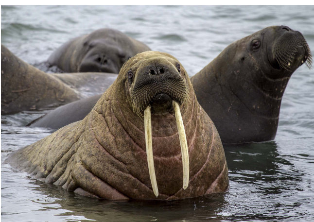
Рис. 5. Самка атлантического моржа ( Odobenus rosmarus rosmarus ), архипелаг Земле Франца-Иосифа.